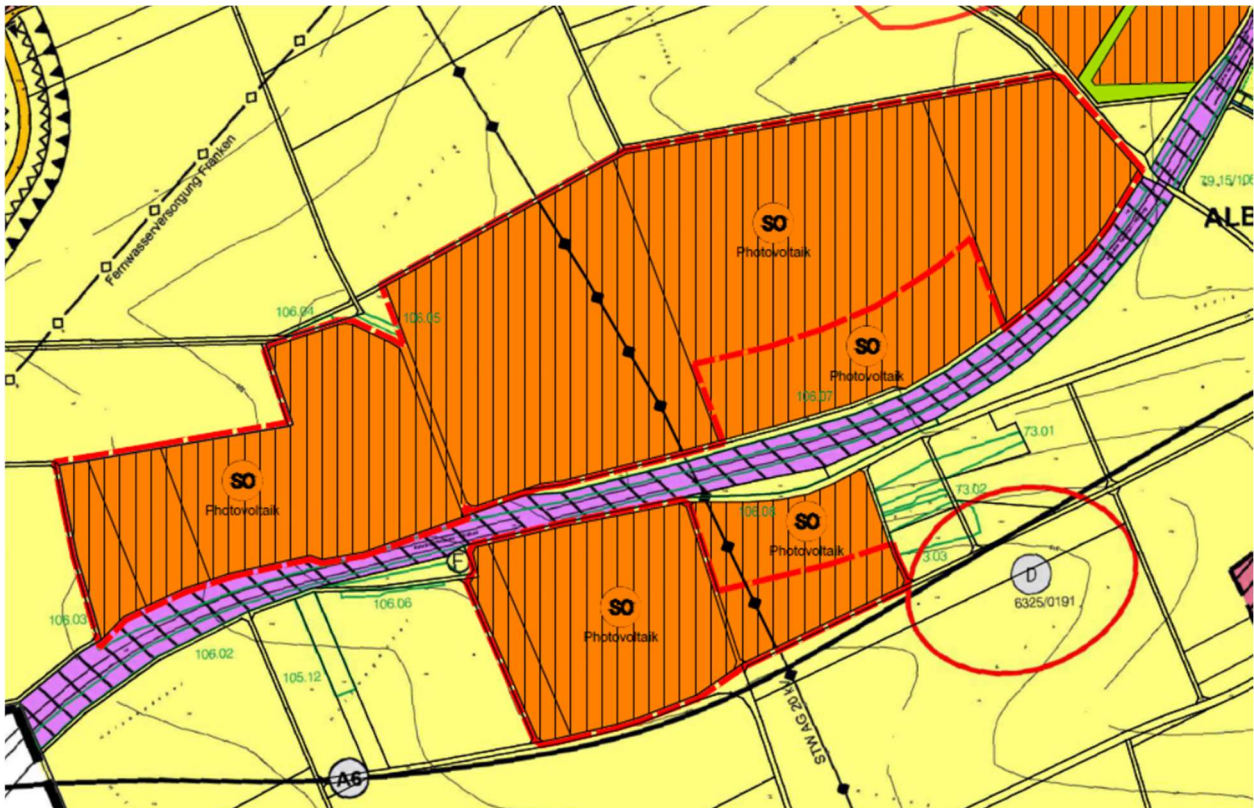
Ausschnitt aus der 15. Änderung des Flächennutzungsplans des Marktes Reichenberg, Planstand: 20.02.2024

Die überplanten Flächen werden derzeit als Ackerbauflächen genutzt. Auf einer Teilfläche des Flurstücks 740 nördlich der Bahnlinie sowie auf einer Teilfläche des Flurstücks 141 südlich der Bahnlinie bestehen bereits zwei Solarparks, welche nun erweitert werden sollen. Des Weiteren grenzen an die Uengershausener Straße, die das Plangebiet nach Osten begrenzt, ebenfalls zwei Solarparks an. Das Plangebiet wird von Ackerflächen umrahmt. Entlang der Bahnlinie liegen als Biotop ausgewiesene Hecken und Gebüsche.